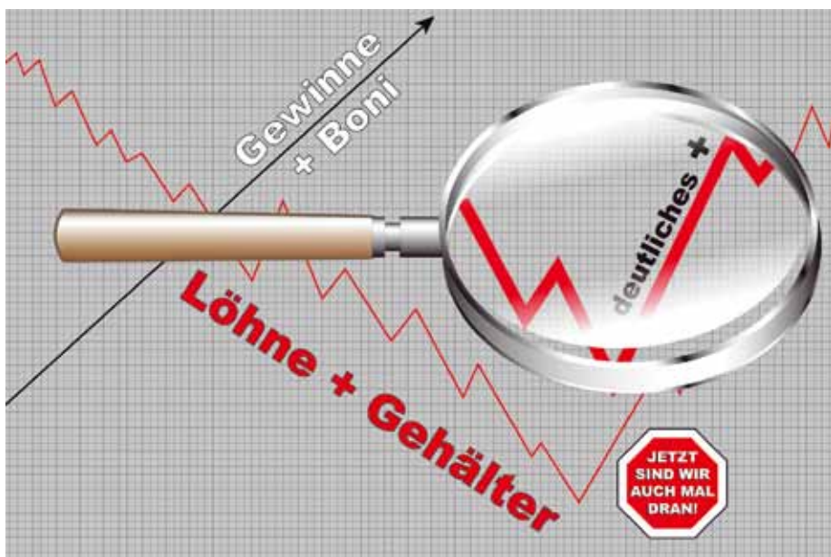
Der DBB fordert ein kräftiges Einkommensplus bei den diesjährigen Tarifverhandlungen.