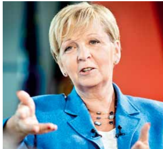
Ministerpräsidentin Hannelore Kraft ist gut beraten, den Nachtragshaushalt zu Gunsten des Vollzuges nachzubessern.

Gerade zugezogene Kleinkriminelle aus nordafrikanischen Ländern, die zudem auch vor sexuellen Übergriffen im öffentlichen Raum nicht zurückschrecken, betrachten den Umgang des deutschen Staates mit seinen Bürgern eher als Ausdruck einer verweichlichten westlichen Liberalität, die man für unlautere Absichten nutzen kann, von der man sich aber nicht abschrecken oder beeindrucken lässt. Besonders ausgeprägt sind