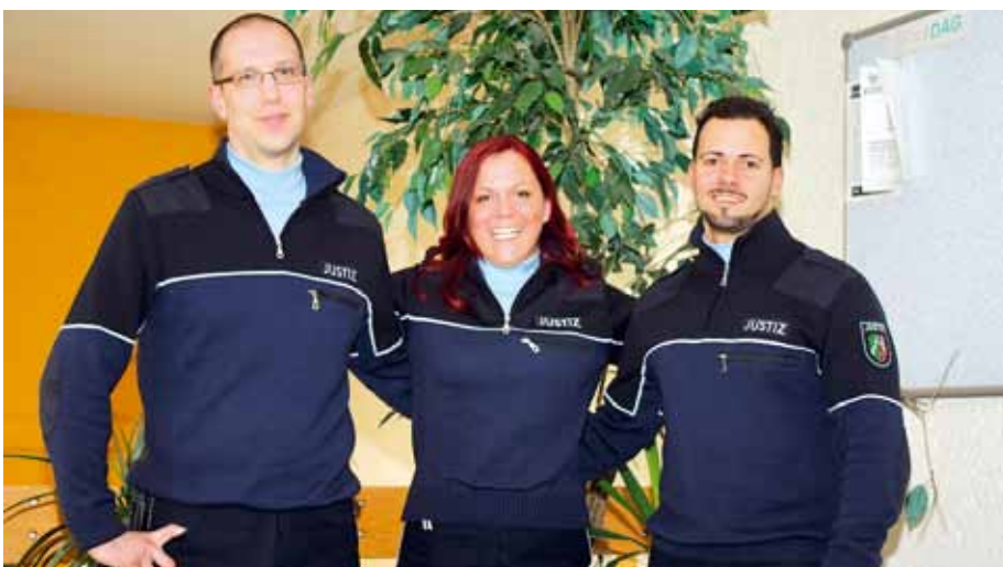
Die Strafvollzugsbediensteten arbeiten gegenwärtig an der Belastungsgrenze und bedürfen der Unterstützung, um die sich abzeichnenden Herausforderungen bewältigen zu können.