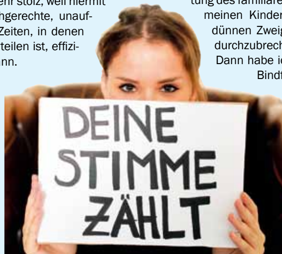
Bei den Personalratswahlen 2016 am 9. Juni 2016 kommt es auf jede Stimme an.

Verschenken wir deshalb nicht unser stärkstes „Kampfmittel“, beteiligen wir uns alle gemeinsam an den Personalratswahlen. Machen wir die Wahlen am 9. Juni 2016 zu einem überzeugenden Votum für unsere Interessen und den BSBD.