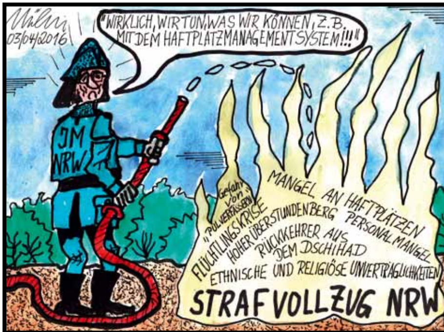
BSBD-Karikatur Thomas Möbis

In Düsseldorf zeigte sich der BSBD -Chef Peter Brock erfreut, dass die monatlichen Warnungen des BSBD endlich durch das Ministerium aufgegriffen würden. „Bei den Diskussionen um die Belegung der nordrhein-westfälischen Vollzugseinrichtungen geht es dem BSBD nicht darum, letztlich Recht zu behalten. Es geht uns vielmehr darum, die Belastungen für die Kolleginnen und Kollegen so zu reduzieren, dass die Grenze der Belastbarkeit nicht überschritten wird“, stellte der Gewerkschafter klar. Nach Ansicht von Brock bietet die Reaktivierung kleiner Vollzugseinrichtungen den sachgerechten Anlass, um beim Finanzminister die erforderlichen Mittel für die personelle Ausstattung dieser Einrichtungen loszueisen. Immerhin hat Finanzminister Dr. Walter-Borjans im Rahmen der Beratungen des Nachtragshaushaltes 2016 bereits angekündigt, dass mit dem Nachtragshaushalt noch nicht alle Finanzierungsbedarfe abgearbeitet seien. Jetzt sei es an der Zeit, so Brock , dass der Justizminister seinen Einfluss im Kabinett geltend mache, um für eine aufgabenangemessene Personalausstattung in den zur Reaktivierung anstehenden Einrichtungen zu sorgen.