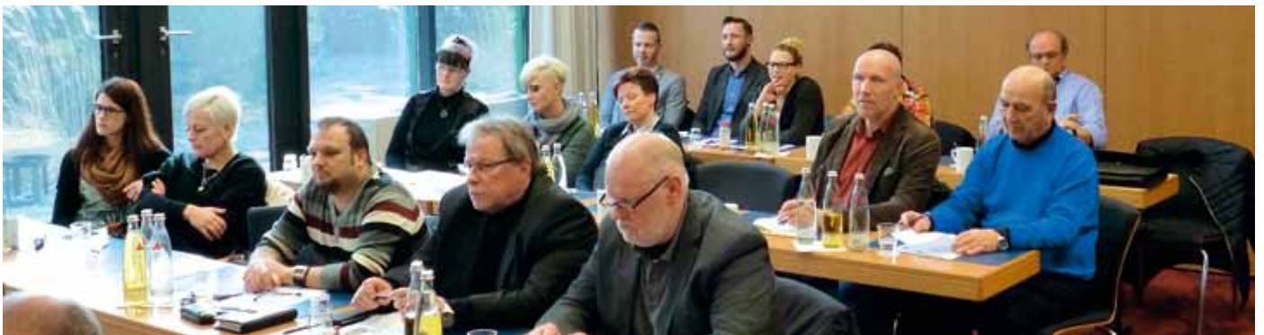
Die Fachschaftsvertreter des BSBD sprachen sich für die Einführung einer flächendeckenden Statistik über verbale und körperliche Übergriffe von Gefangenen aus, um die Dimension einer gefühlt negative Entwicklung mit konkretem Zahlenmaterial zu belegen oder zu widerlegen.

Das Gremium war sich einig, dass diese Überlastung der Kolleginnen und Kollegen zeitnah beendet werden müsse, zumal sich weitere Herausforderungen bereits abzeichneten, für deren Wahrnehmung nochmals 350 Personalstellen zu veranschlagen seien. Von der Politik sei nachdrücklich die Behebung dieses Missstandes zu verlangen. Als überaus kritikwürdig schätzten die BSBD-Man-