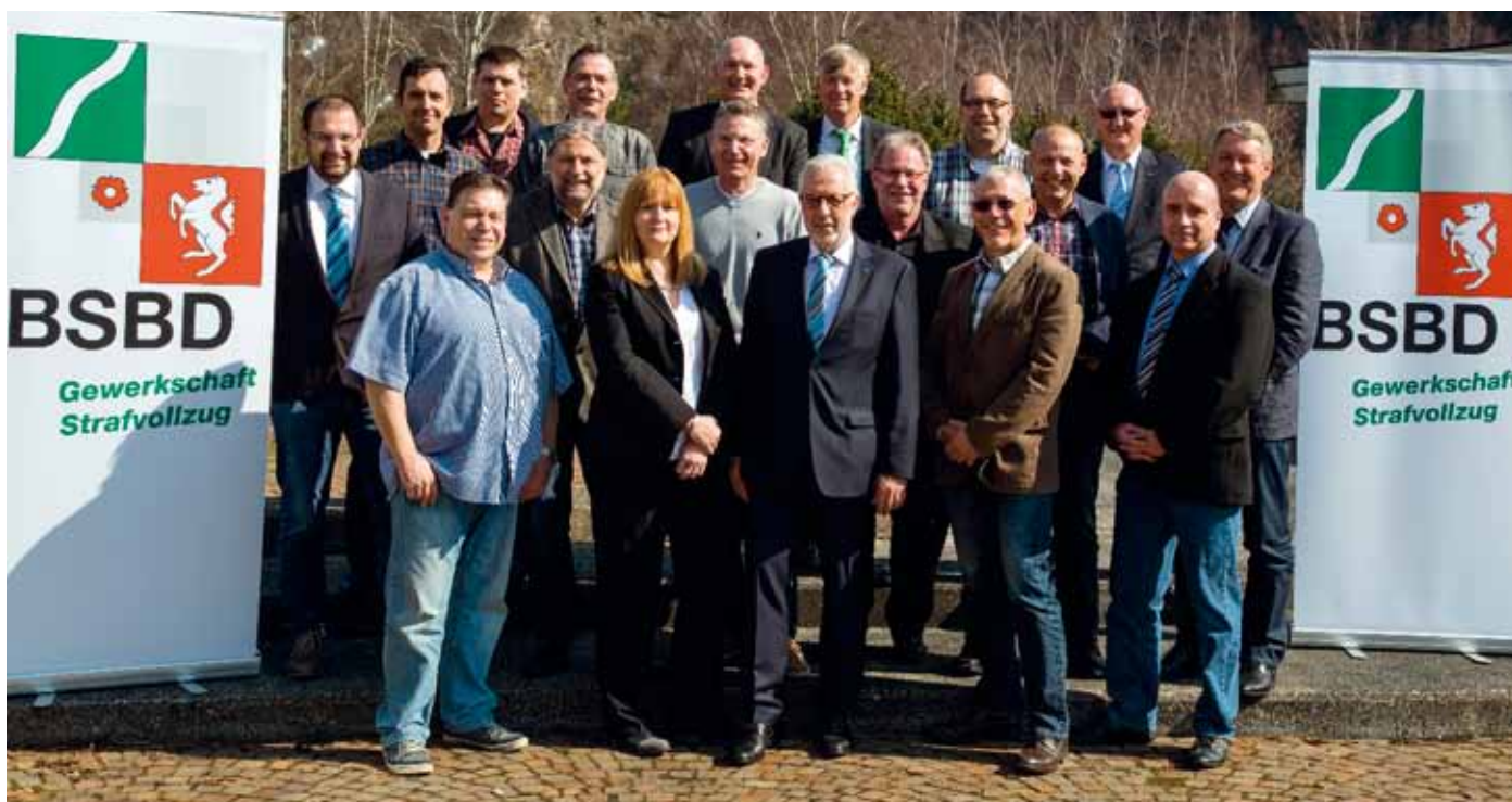
Die BSBD-Kandidatinnen und Kandidaten für die Wahlen zum Hauptpersonalrat Justizvollzug am 9. Juni 2016.

eine schlagkräftige Mannschaft nach Düsseldorf zu entsenden, um die spezifischen Interessen des Strafvollzuges und der Kolleginnen und Kollegen sachgerecht, fundiert und kompetent gegenüber der Ministerialbürokratie vertreten zu können. Das durch die Delegierten zusammengestellte Team stützt sich auf