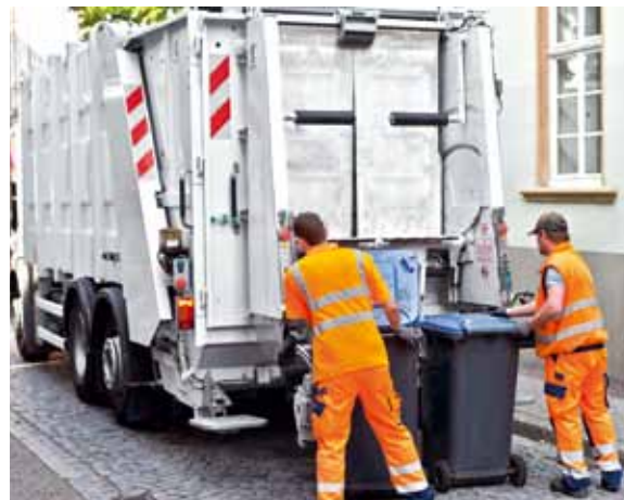
Die Tarifverhandlungen für Bund und Kommunen gestalten sich schwierig.

Es ist, dies muss auch den öffentlichen Arbeitgebern bewusst sein, sehr schlech-