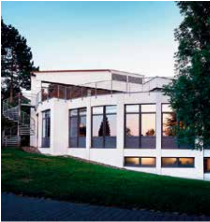
Die Fortbildung fand in der idyllischen Atmosphäre des DBB-Forums Thomasberg statt.

rungsaufsicht. Das Gefängnis sei – institutionell bedingt – ein Ort, der unter Umständen Problemfelder perpetuiere, anstelle sie abzumildern.