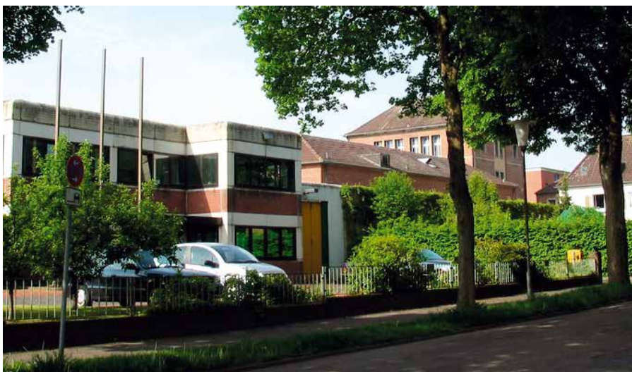
Justizminister Peter Biesenbach (CDU) hat eine Expertenkommission eingesetzt.

Schaffung der rechtlichen Voraussetzungen für Zwangsmedikationen vor.