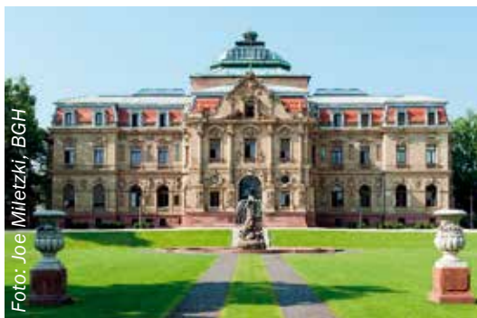
BGH Karlsruhe verkündet Urteil Ende November 2019.

hebung des Limburger Urteils führen könnte, doch sicher kann man sich nicht sein, bevor das Urteil gesprochen ist. In der Verhandlung am 25. September 2019 plädierten sowohl die Verteidiger der Angeklagten als auch die Vertreterin der Bundesanwaltschaft, das Urteil des Landgerichts Limburg aufzuheben.