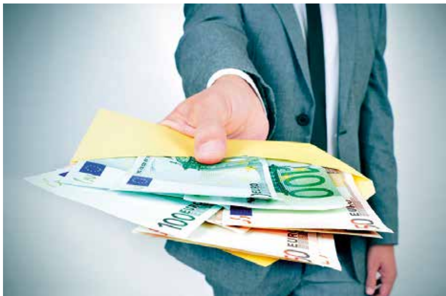
Die Steuer- und Abgabenlast ist für den Mittelstand deutlich zu hoch.

Bei der Belastung der Einkommen aus unselbständiger Arbeit ist zwischenzeitlich ein Zustand erreicht, der sich nachhaltig motivationshemmend auswirkt. Leistung lohnt sich speziell für die Angehörigen der Mittelschicht kaum noch, weil ihnen viel zu wenig netto verbleibt. Erst bei den Besserverdienern ist der