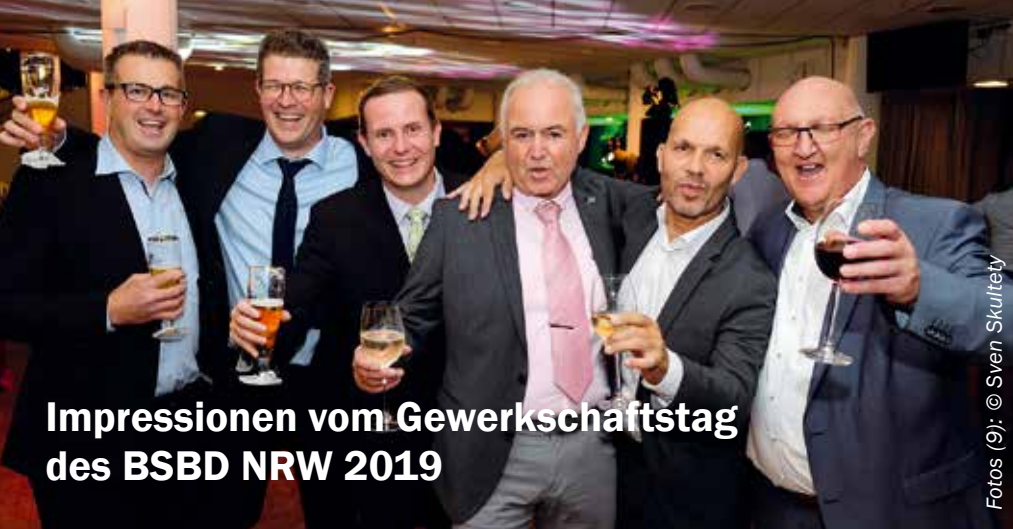
Impressionen vom Gewerkschaftstag des BSBD NRW 2019