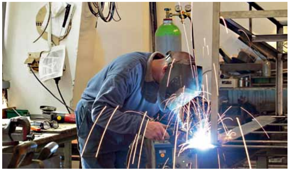
Der Werkdienst hat sich täglich in der Arbeit mit Gefangenen zu beweisen.

„Mein fester Glaube, Herr Vorsitzender.“ „Ihr fester Glaube?“, fragte der Richter ungläubig. – „Ja, ich habe fest geglaubt, die Bank hätte keine Alarmanlage.“