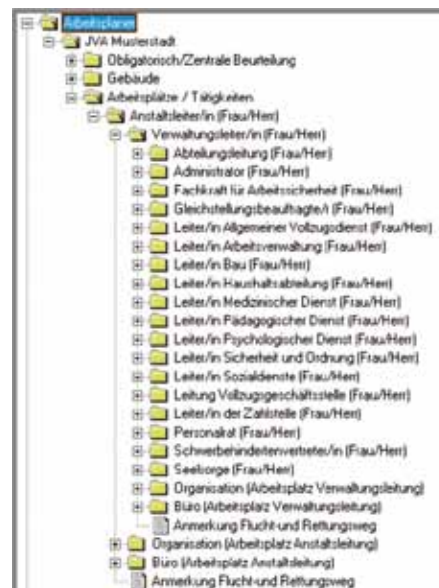
Dateibaum „JVA Musterstadt“

Parallel zur Anpassung der „Handlungshilfe 4.0“, die nunmehr als Webanwendung auf Basis der Java Enterprise Edition (JEE)-Technologie administratorenfreundlich in jedem Internet-Browser