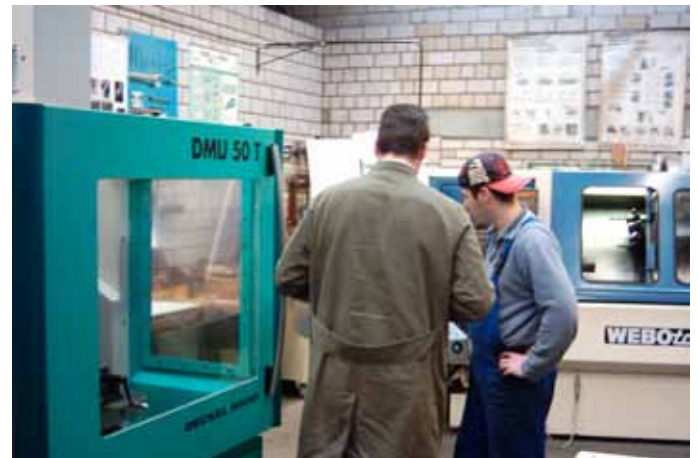
Die Anleitung und Ausbildung von Gefangenen ist eine anspruchsvolle Aufgabe, die angemessen zu dotieren ist.