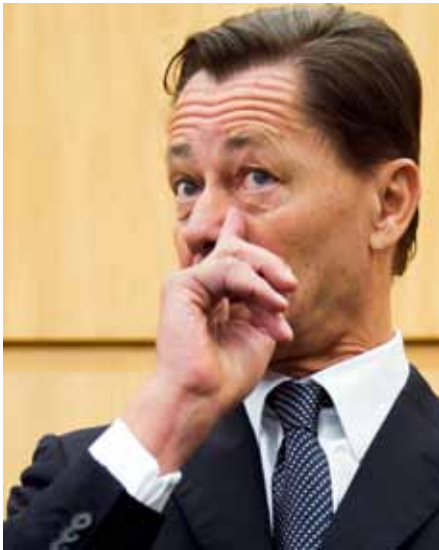
Mit seinen Verteidigern strebt Dr. Thomas Middelhoff die zeitnahe Entlassung aus der Untersuchungshaft an.