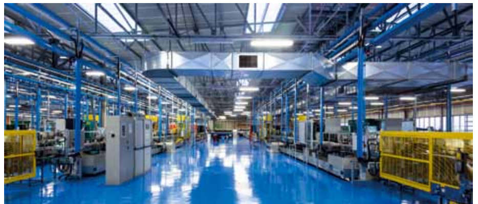
Die Privilegien der Erben von Unternehmen hat das Bundesverfassungsgericht kassiert.

Gleich nach dem Bekanntwerden dieser Vorstellungen drängten die Unternehmerverbände mit ihrer Kritik an die Öffentlichkeit, sehen sie doch einige ihrer bedeutendsten Privilegien in Gefahr. Sie beschwören den Untergang deutscher