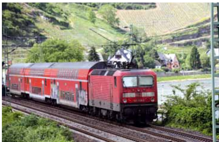
Branchengewerkschaften, wie wir sie bei der Bahn vorfinden, sind der Bundesregierung zu kampfkraftig geworden.

deskanzlerin hat uns das (Tarifeinheitsgesetz) zugesagt und wir dürfen heute dankbar feststellen, dass ihr Wort auch in Sachen Tarifeinheit nachdrücklich gilt.“