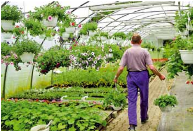
Nicht nur die Arbeitsprozesse müssen gestaltet werden, auch der wirtschaftliche Erfolg sollte stimmen.

Das Gericht kommt deshalb zu dem Schluss, dass eine den geltend gemachten Anspruch begründende evidente