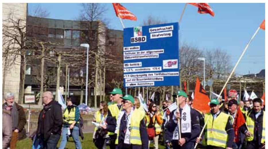
Der BSBD-NRW war bei der Abschlusskundgebung vor dem Düsseldorfer Landtag mit mehr als 800 Kolleginnen und Kollegen vertreten.

Der dritten Verhandlungsrunde am 16. März 2015 in Potsdam wurde vorentscheidende Bedeutung zugesprochen. Nachdem die Arbeitgeber bis dahin hinhaltend taktiert hatten, mussten die