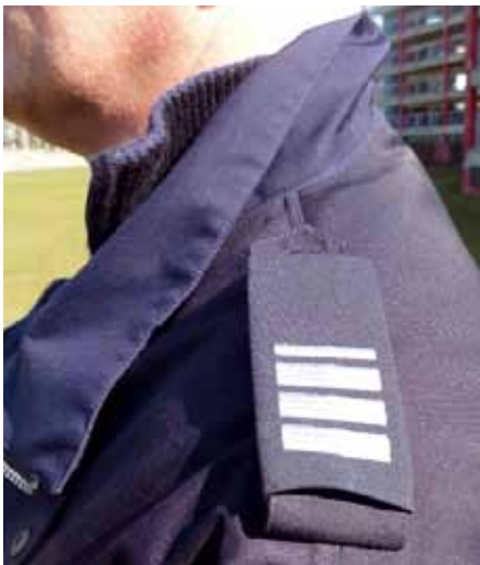
Jede Kollegin und jeder Kollege entscheidet nach dem Willen des Justizministeriums selbst über das Tragen von Dienstrangabzeichen.

Zwischenzeitlich sind die zugelassenen Lieferanten von Dienstkleidung in der Lage, auch Dienstrangabzeichen anzubieten. Hier und da tauchen bereits erste Träger von Dienstrangabzeichen im Berufsarbeitsalltag auf. Eines lässt sich bereits jetzt sagen: Die Akzeptanz der Dienstrangabzeichen durch die Öffentlichkeit scheint vorhanden zu sein.