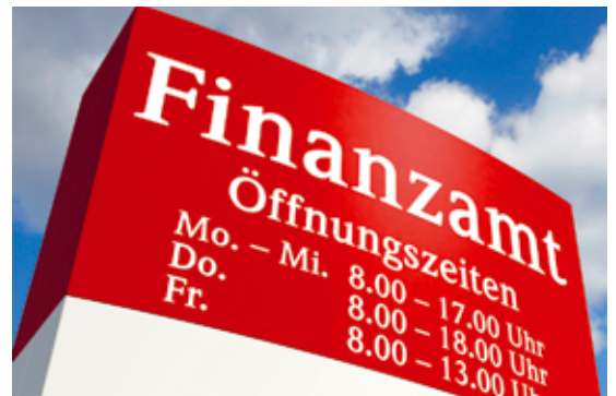
Eine gute Konjunktur sorgt für steigende Einnahmen der Finanzverwaltung.

Sowohl Bundesländer als auch Kommunen werden durch die sprudelnden Steuereinnahmen in der Lage sein, ihr