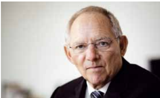
Finanzminister Dr. Wolfgang Schäuble will Firmenerben stärker besteuern.

Wir sind deshalb gut beraten, die weitere Entwicklung genau zu beobachten und zu begleiten, weil hier die ureigensten Interessen des öffentlichen Dienstes „im Feuer“ stehen. Denn: Was der Staat nicht einnimmt, das kann er auch nicht verteilen! Und wenn bei den Gebietskörperschaften mal wieder finanzielle Löcher zu stopfen sind, dann greifen Finanzminister nur allzu gerne den Beschäftigten des öffentlichen Dienstes in die Tasche.